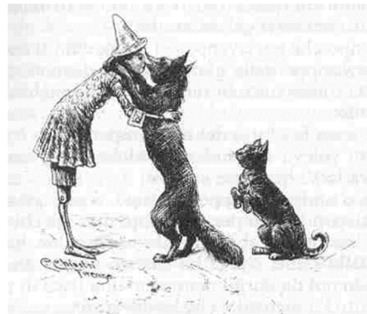
Illustration originale de Carlo Chiostri

Pinocchio , traduit dans toutes les langues, est aujourd'hui un des livres les plus lus au monde.